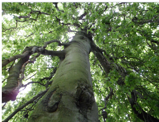
, 15 Mai 2012

XLSX (Excel 2007) - XLS (Excel 1997-2003) .